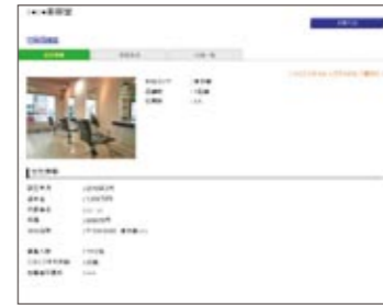
▲「ビーグル」画面イメージ▲

●昨年『ビーグル2010年度』をご利用いただきましたサロン様、誠にありがとうございます。2011年度も 引き続きご利用いただけますよう、お願い申し上げます。つきましては、このお知らせの 中面 をご確認の上、 お申込をいただく必要があります。お手数をおかけいたしますが、何卒宜しくお願い申し上げます。